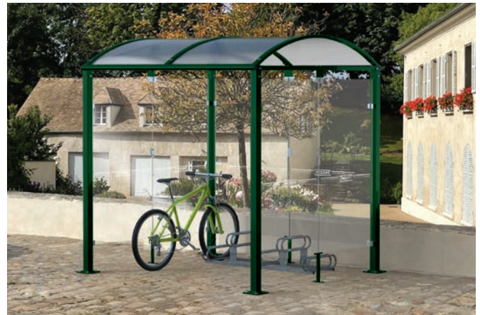
Réf. 529022 + 204719