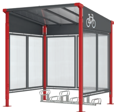
Réf. 529257 + 529252 + 529158 + 529403