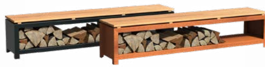
STOCKAGE AVEC SIÈGE