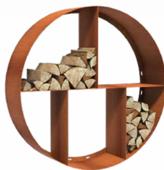
STOCKAGE DE BOIS