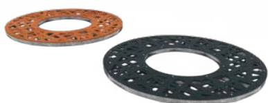
GRILLES D'ARBRES ROND

Pour un aperçu complet de tous les modèles et des options spécifiques au produit, visitez www.furns.com .