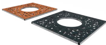
GRILLES D'ARBRES CARRÉ